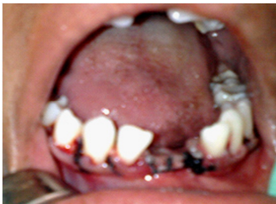
Figure 4: Vue chirurgicale : les points de sutures de la voie d'accès

La pièce opératoire après son énucléation a été fixée dans du formol à 10 % et adressée pour l'examen anatomopathologique.