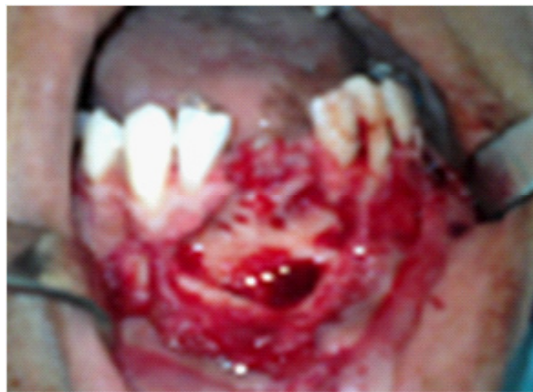
Figure 3: Vue chirurgicale : cavité opératoire après énucléation et extraction 31 et 41