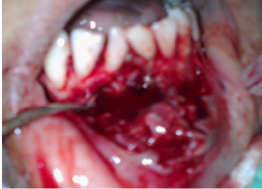
Figure 2 : Vue chirurgicale : le décollement d'un lambeau de pleine épaisseur trapézoïdale et résection osseuse

La résection apicale, d'environ 3mm, effectuée sur les deux incisives latérales (32-42) a permis d'améliorer la visibilité et d'éliminer tous les tissus inflammatoires susceptibles de provoquer une récurrence kystique (fig. 2, 3, 4).